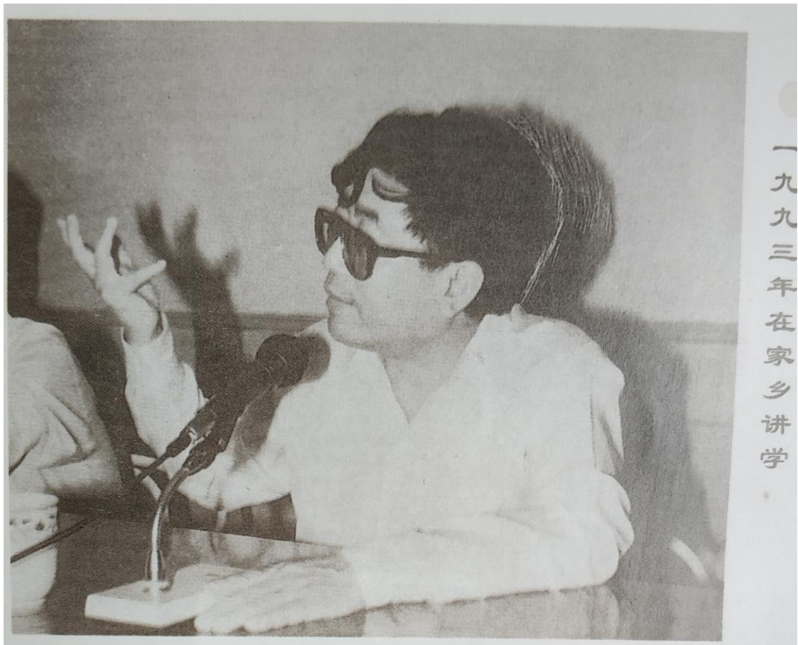
一九九三年在家乡讲学