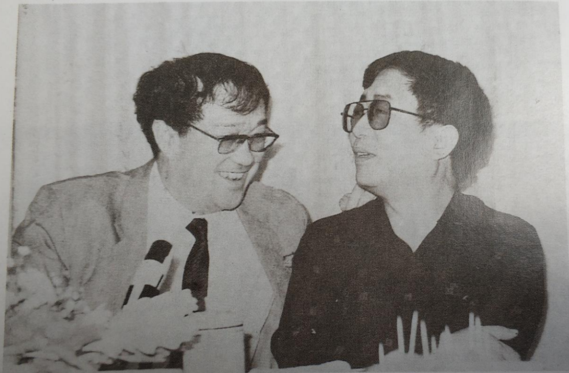
被谢晋导演聘为艺术顾问