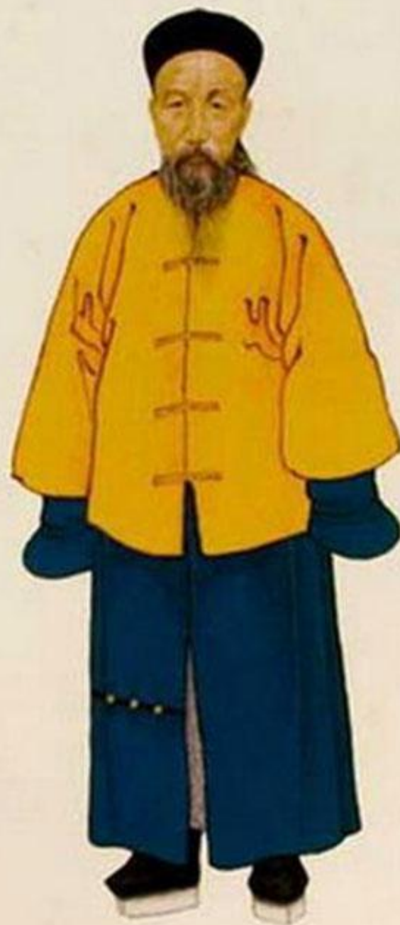
贈太傅原任武英殿大學士兩江總督一等毅勇侯諡文正曾國藩