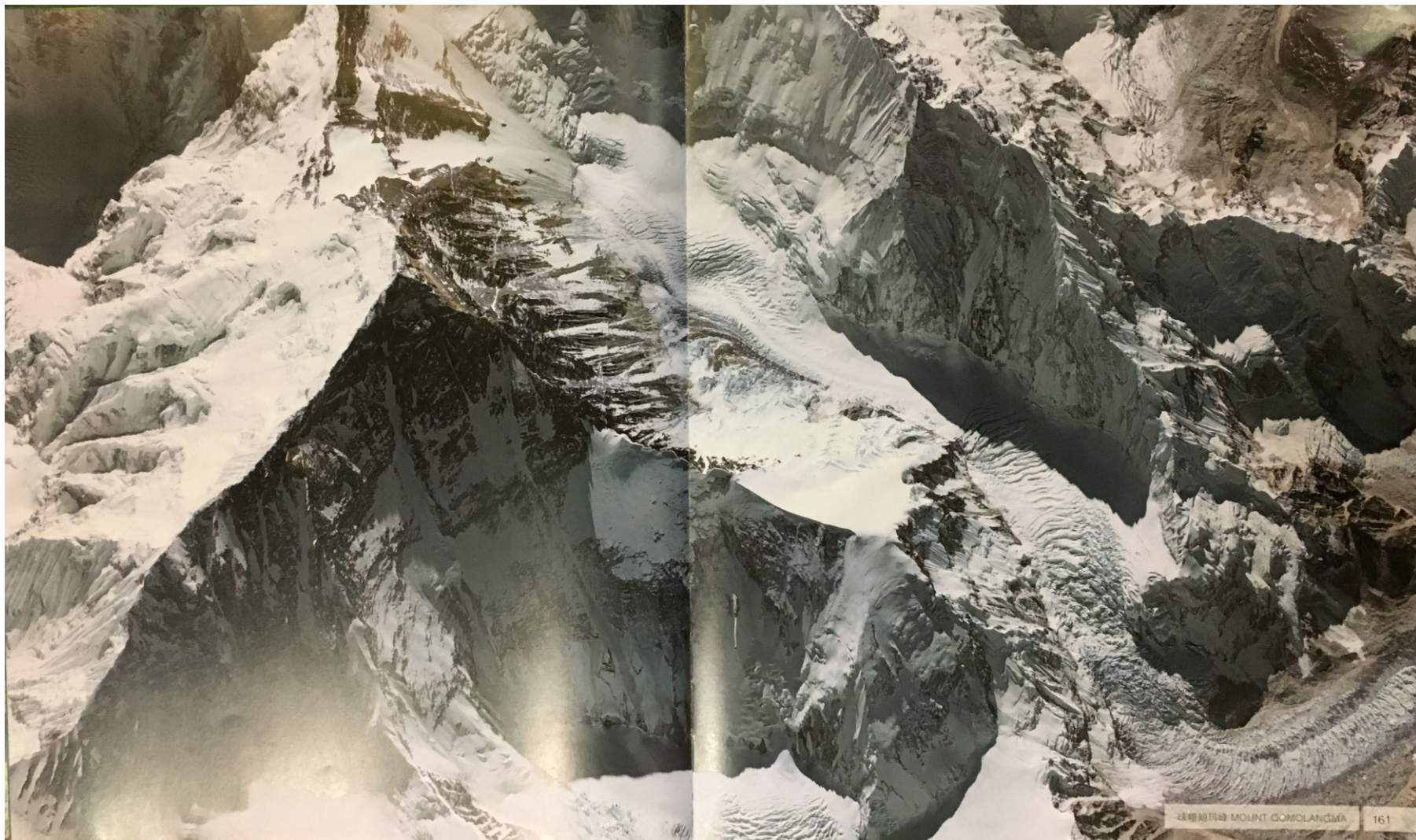
珠穆朗玛峰（2009年11月航拍）